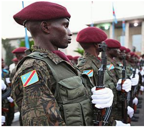
Kongo Demokratinės Respublikos „Respublikos apsaugos“ kariai iškilmingoje rikiuotėje 2010 m. 31