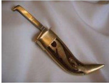
Nuotraukoje tipinis šių dienų sikho nešiojamas peilis arba kardas – kirpan . 38

2015 m. spalio mėn. per išplitusius smurtinius sikhų protestus prieš Pandžabo valdžią, policija šaudė į protestuotojus nukaudama du ir sužeisdama 80 žmonių po to, kai protestuotojai sukilo penkiuose Pandžabo rajonuose po pranešimų apie nežinomų asmenų išniekintą šventą sikhų knygą. Policija sulaikė nemažiau 12-kos sikhų ir apkaltino juos pasikėsiniu nužudyti, viešo turto suniokojimu, neteisėtu ginklų nešiojimu. Sikhų žuvimas sukėlė pyktį sikhų bendruomenėje ir šie ėmė blokuoti kelius ir tiltus reikalaudami nubausti šventos knygos išniekintojus. 39